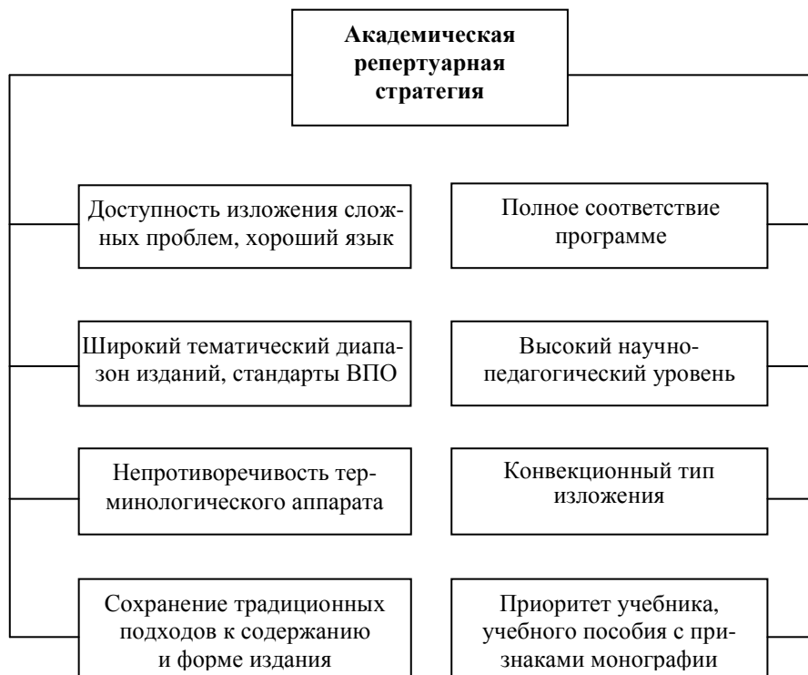
Рис. 2. Основные типологические признаки академической репертуарной стратегии

Основные типологические признаки академической репертуарной стратегии можно представить в виде схемы, представленной на рис. 2. Учебные дисциплины по таким наукам, как история, философия, филология, культурология, социология, должны быть обеспечены учебниками в их классическом понимании.