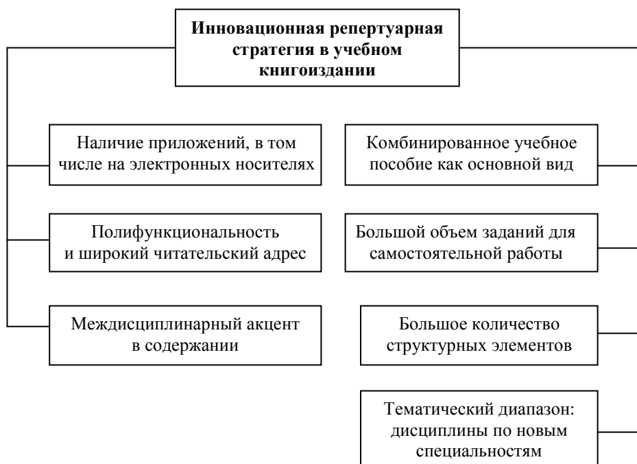
Рис. 3. Типологические признаки инновационной модели учебного издания

ков по различным дисциплинам. Были получены следующие результаты: иногда испытывают затруднения при понимании текстов учебников 56,6 % студентов, редко – 15,7 %, часто – 15,7 %, никогда – 8,4 %, почти всегда – 3,6 %. При этом 74,4 % студентов считают, что затруднения при понимании учебных текстов связаны в первую очередь со способом изложения материала, а 25,6 % – со сложностью содержания. Их опрос дал и более дифференцированные показатели. В целом вычленение главной мысли важно для 66 % студентов, а понимание логики изложения – для 43,4 %. Эти данные показывают, что в учебнике совершенно необходимо соблюдение правил логического изложения материала, выделение главной мысли, тщательная продуманность рубрикаций и графических материалов, помогающих оптимальному усвоению учебного предмета.