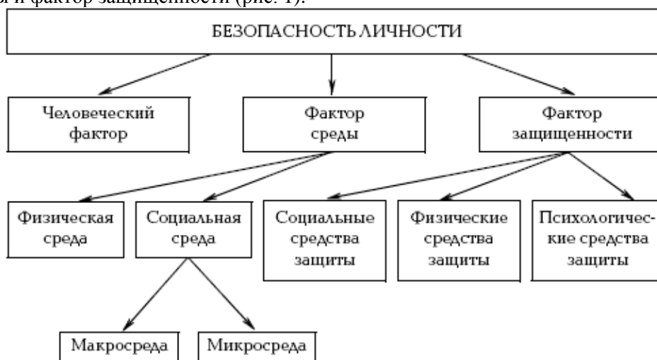
Рис. 1. Факторы безопасности личности

Раскрывая понятие психологической безопасности образовательной среды учебного заведения, необходимо определить понятие безопасности личности. Известный американский психолог А. Маслоу потребность в безопасности и защите считает первичной по шкале потребностей. Для каждого человека личная безопасность, а также безопасность его родных и близких является одной из ключевых ценностей. Для личности безопасность определяют три фактора: человеческий фактор, фактор среды и фактор защищенности (рис. 1).