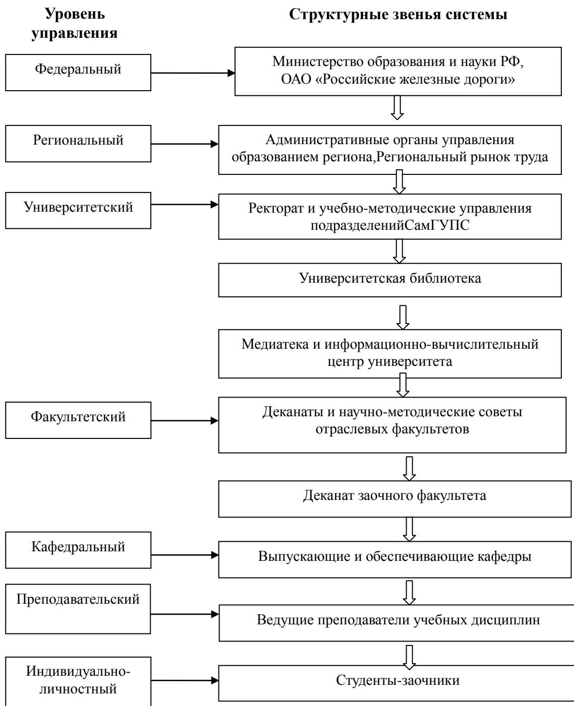
Рис. 1. Модель иерархической инфраструктуры системы управления, организации, обеспечения и поддержки самостоятельной работы студентов