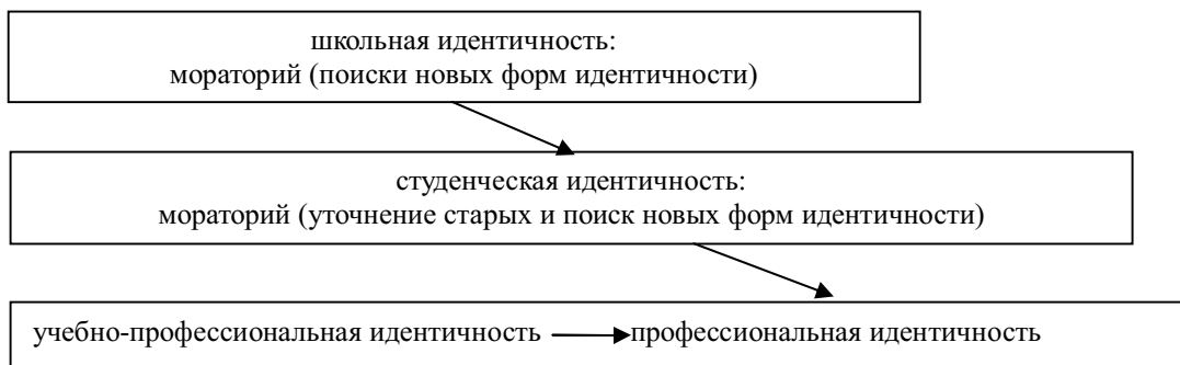
Рис. 1. Этапы становления профессиональной идентичности личности

Результаты исследований многих авторов доказывают, что первый этап профессионализации человек проходит в студенческом возрасте. Качественный скачок в профессиональном развитии человека происходит в ходе профессионального обучения. Профессиональное обучение является основой формирования профессиональной идентичности студентов. Именно в студенческом возрасте начинают формироваться основные идентификационные характеристики, выражающие принадлежность человека к определенной профессии. В процессе становления профессиональной идентичности можно выделить несколько этапов (рис. 1).