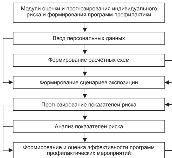
Рис. 2. Общая схема взаимодействия модулей ИАС.

тодами физио- и фитотерапии, обеспечивающими стимуляцию процессов микроциркуляции и лимфодренажа для выведения токсичных веществ из органов-депо;